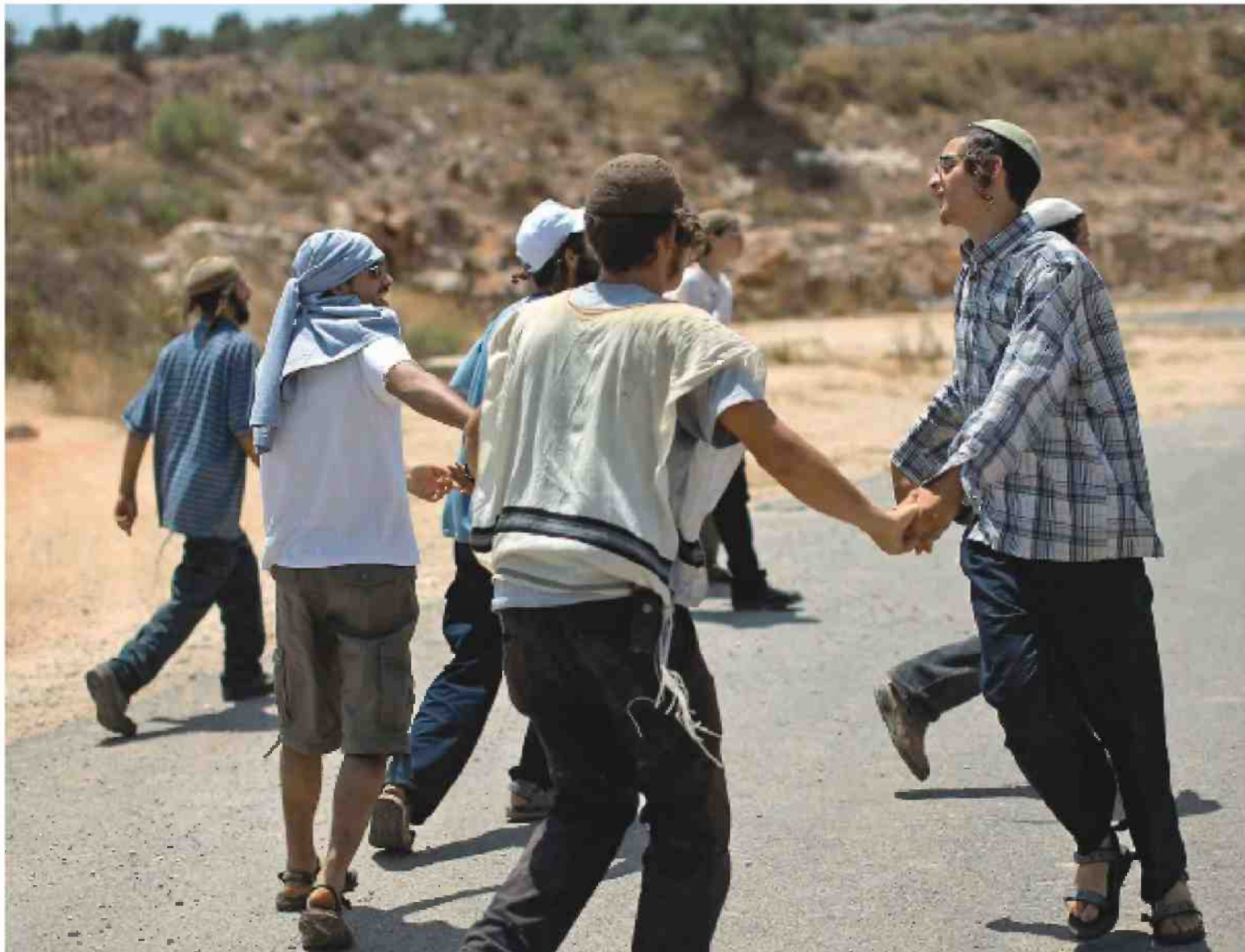
נוער הגבעות מרקד בצעידה משכם ליריחו, 2010. נערי הגבעות מורדים ברבנים שלימדו אותם, אולם לא בתורותיהם

נוער הגבעות, ובכלל זה הטרוריסטים שיצאו מקרבו, מגלמים מקרה פרטי של התופעה הכ-ללית הזאת, שבמסגרתה מימוש עצמי בציונות הדתית כבר אינו נתפס כמותנה בחיבור לקול-קטיב הלאומי, אלא להפך, מתבסס על בקשה אישית אחר ביטוי עצמי. בניגוד לתופעות הניאור-חסידיים בכלל, תושבי הגבעות לא מסתפקים במסע רוחני אישי המקביל לחיים בחברה הכ-ללית, אלא מבקשים למצוא אותנטיות דווקא על ידי פרישה חד-משמעית מהכלל. המרד הקי-צוני שלהם בחברה הכללית - ודווקא הוא - מא-פשר להם להחשיב את עצמם לנאמנים היחידים האמיתיים לתורה ולאליהם.