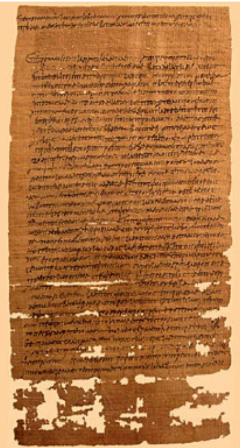
שטר קניין על ארבעה מטעי תמרים בכעלות בכתא