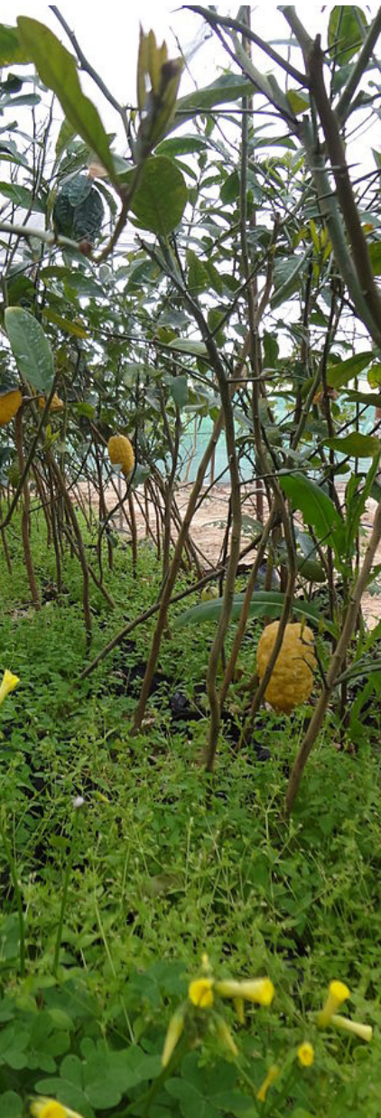
פרדס אתרוגים בכפר חב"ד שאינו מעובד בשנת השמיטה, וצמחו בו עשבים שוטים.

2. קראו את שלושת הציטוטים שלפניכם. בחרו את הציטוט שתואם בצורה הטובה ביותר את השקפת עולמכם בנוגע לאופן שבו יש להתייחס למצוות שבחרתם לעיל. לסיכום, נסו לזהות את העמדה שבאה לידי ביטוי בתקנת הפרזבול שהנהיג הלל הזקן.