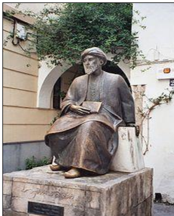
פסל הרמב"ם בקרדובה, ספרד

מתודה פרשנית ודידקטית זו, על מרכיביה השונים שהוצגו לעיל ועל ההתכוונויות החינוכיות שבה (וכן דרכי ההערכה חלופיות הנגזרות ממנה), אינה הדרך הסטנדרטית בהבנת הספר, והיא אכן חסרה (כגישה שיטתית) במרבית ספרות העזר על "שמונה פרקים". ניסיון עקבי ללכת בה עשוי לזמן חוויה מיוחדת של קריאה ולימוד ברמב"ם. בעזרתה ירכשו התלמידים דרכי חשיבה, ניתוח וטיעון, שיפתחו בהם קשב לרבדים הסמויים של טקסט (כתוב ונאמר), רגישות לקולו של ה"אחר", מחויבות לחשיבה שיטתית ורציונאלית, וחוש ביקורת משל עצמם כלפי חייהם וכלפי המציאות הסובבת אותם. כל אלו יסייעו בידיהם לגבש בכוחות עצמם את אישיותם ואת השקפת עולמם בדרך פתוחה, מעמיקה ומושכלת. האתגר האינטלקטואלי (ולעתים, האלטרנטיבה) שמציב הרמב"ם לקורא מחייבת אותו לחשוב מחדש על היבטים מרכזיים בחייו, היבטים המתקבלים בדרך כלל כמובנים מאליהם, ובהמשך לנסות ולנסח מחדש (ובהכרח, גם לחדש) את השקפת עולמו.