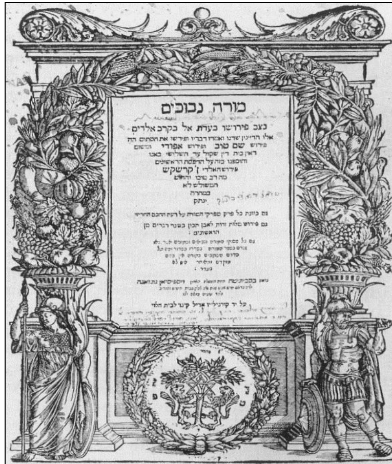
הפתיחה של מורה נבוכים

זיהוי הקשיים השונים (על שלושת סוגיהם) והעמידה עליהם בשלב מוקדם של הלימוד היא חיונית. חשוב שהמורה יהיה מודע מראש לקשיים הללו, וייתן דעתו עליהם בתכנון הוראתו ובעת הוראתו בפועל. יתירה מזו, ככל שניטיב לזהות כהלכה את הקשיים, נוכל להתייחס אליהם ואף לנצל אותם בעת לימדנו, כלומר, לתת להם "תפקיד" פוזיטיבי בתהליך הבנת הספר ובפרשנותו. לדעתנו, אין לנתק בין ההבנה ובין ההוראה, ולמעשה אנו אף טוענים כאן להיפוך מסוים של היחס בין השניים. אמרה ידועה קובעת כי רק מי שמשוגל ללמד דבר, אמנם מבין אותו לאשורו. ההוראה אם כך איננה פעולה נפרדת (ויש שיטענו, לא רלוונטית) מן ההבנה, אלא אדרבה: היא עשויה לקדם ואף לכוון אותה. זו הגישה שנבקש לנקוט להלן, בניסיון להציע דרך להתמודד עם הקשיים השונים בהוראת הספר, ומיניה וביה – בהבנתו.